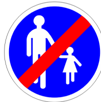
Fin de chemin obligatoire pour piétons