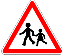
Endroit fréquenté par les enfants