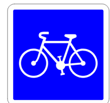
Piste ou bande cyclable conseillée et réservée aux cyclistes