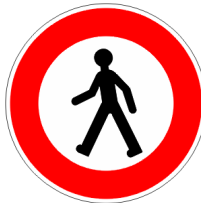
Accès interdit aux piétons