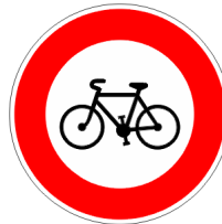
Accès interdit aux cyclistes