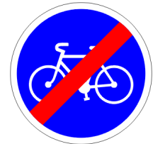
Fin de piste ou bande cyclable obligatoire pour cyclistes