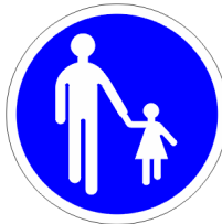
Chemin obligatoire pour piétons