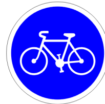
Piste ou bande cyclable obligatoire pour cyclistes