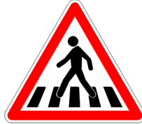
Passage pour piétons