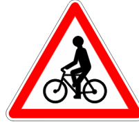
Débouché de cycliste ou de cyclomotoriste venant de la droite ou de la gauche