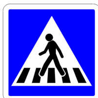
Passage pour piétons